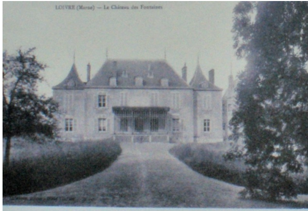
La façade du Château avant 1914