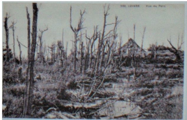
Le parc du château après les bombardements