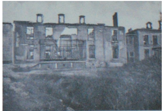
La même façade, victime des bombardements