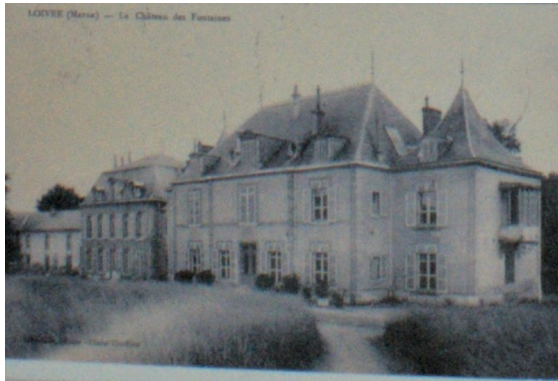
L'arrière du château, vu du parc, avant 1914