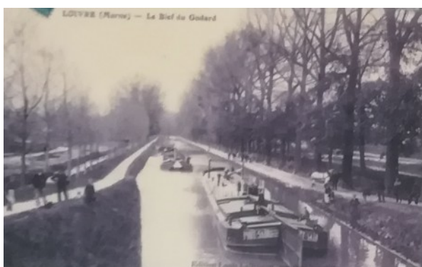
Le bief du Godard (direction Berry-au Bac) vu de l'écluse de Loivre A droite, les chevaux de Halage.