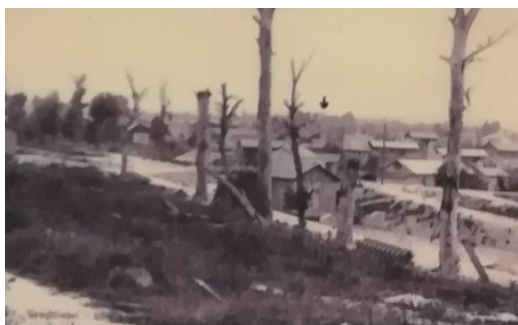
Le village au début de la reconstruction, avec, au premier plan, l'écluse de Loivre. On aperçoit (flèche) les ruines de la sucrerie.