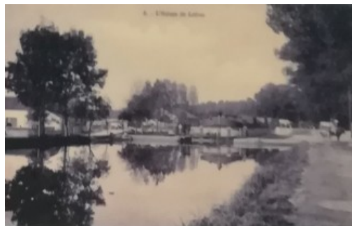
L'écluse de Loivre, côté bief de la Verrerie : un joli coin de campagne.