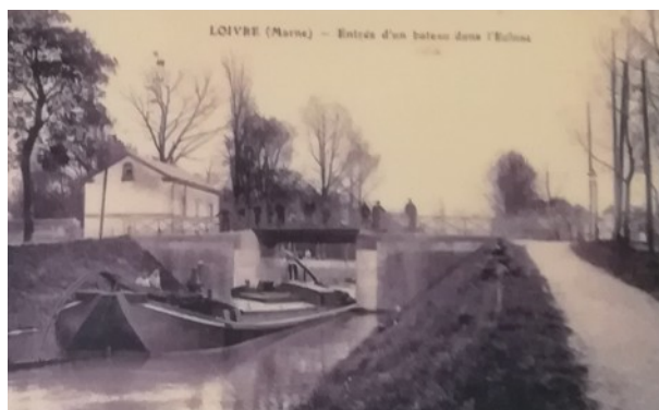
L'écluse de Loivre, côté bief du Godard. A gauche, le bureau télégraphique