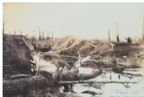
L'écluse détruite par la guerre 1914-1918, au début de la reconstruction.