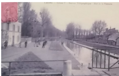
Le bief de la verrerie, vu de l'écluse de Loivre.. A gauche, le bureau télégraphique