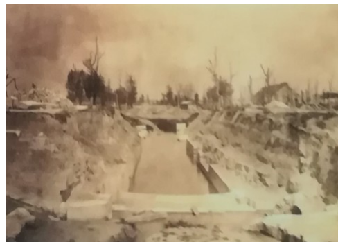
L'écluse détruite par la guerre 1914-1918, au début de la reconstruction. A droite, les ruines de la verrerie.