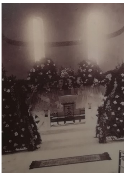
Inauguration des cloches