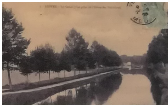
Le bief de la verrerie avant 1917, vu de l'écluse des Fontaines