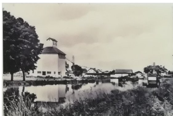
Le bief de la verrerie après 1937, date de l'installation sur le port du silo de la Providence agricole (le bâtiment a changé de forme aujourd'hui). On aperçoit à droite un tracteur de la C.G.T.V.N.