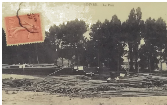
L'activité du port avant 1914

Le premier projet d'un canal reliant Reims à l'Aisne en rendant navigable la Vesle fut décidé en 1556, sous l'impulsion du cardinal de Lorraine, archevêque de Reims. Mais les travaux, freinés par l'opposition de certains riverains, avancèrent très lentement et furent abandonnés à la mort de l'archevêque en 1585.