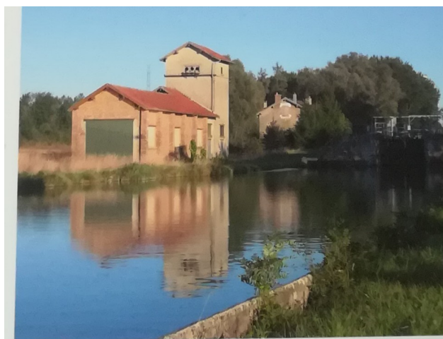
Hangar à Tracteurs

Notons enfin que depuis plus de trente ans un projet de canal à grand gabarit est à l'étude.