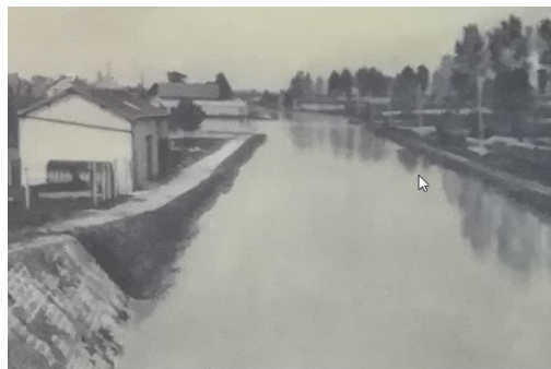
Le bief la verrerie reconstruit, après 1935 : à droite C.G.T.V.N.N