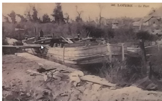
Le port détruit par la guerre : péniches échouées faisant office de passerelles.