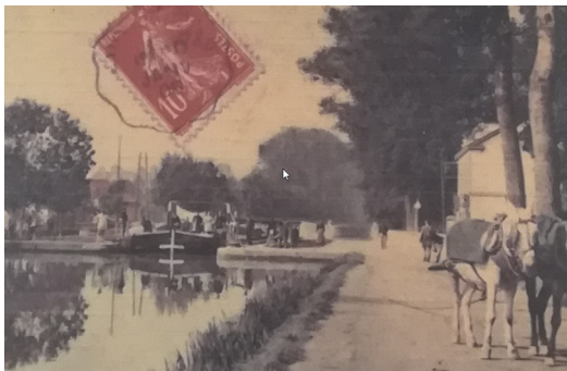
Halage par chevaux à l'écluse de Loivre