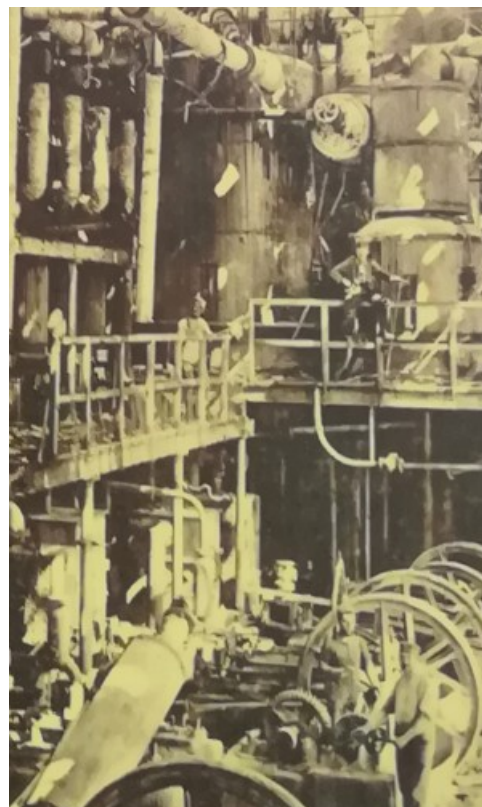
Intérieur de la sucrerie pendant la guerre 14-18