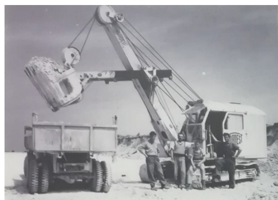
Employés de la M.E.A.C avec leurs matériels ( 2 e à partir de la gauche Mr Wiewewski décédé en 2002)