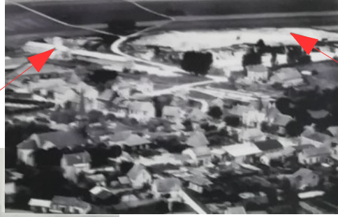
Vue générale de la Motterie

disparut dans les années 60 parce qu'elle n'était plus rentable.