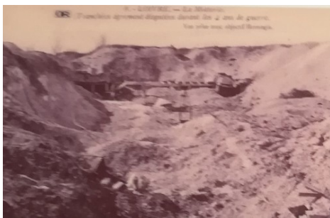
La motterie transformée en champ de bataille pendant la guerre de 1914-1918

Les souterrains creusés pour l'extraction de la craie servaient aussi de champignonnières.