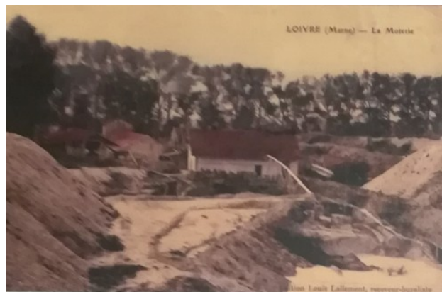
La motterie vue du sommet du talus en direction du canal

Avant 1914 existait à Loivre dans la zone occupée depuis par la décharge municipale, une entreprise appelée « motterie » parce qu'elle extrayait des mottes de craie pour fabriquer du blanc d'Espagne (produit utilisé pour l'entretien des chaussures de toile).