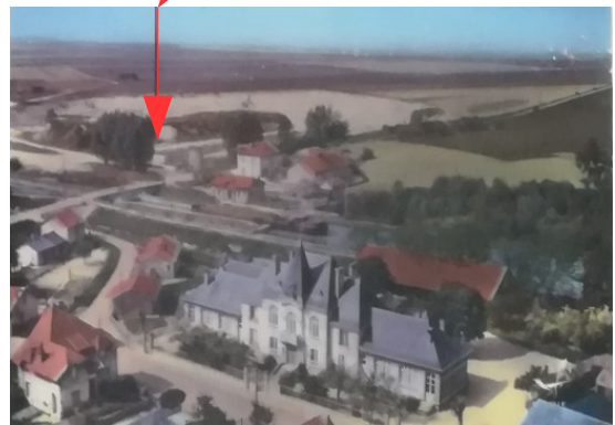
Zone d'extraction de le M.E.A.C